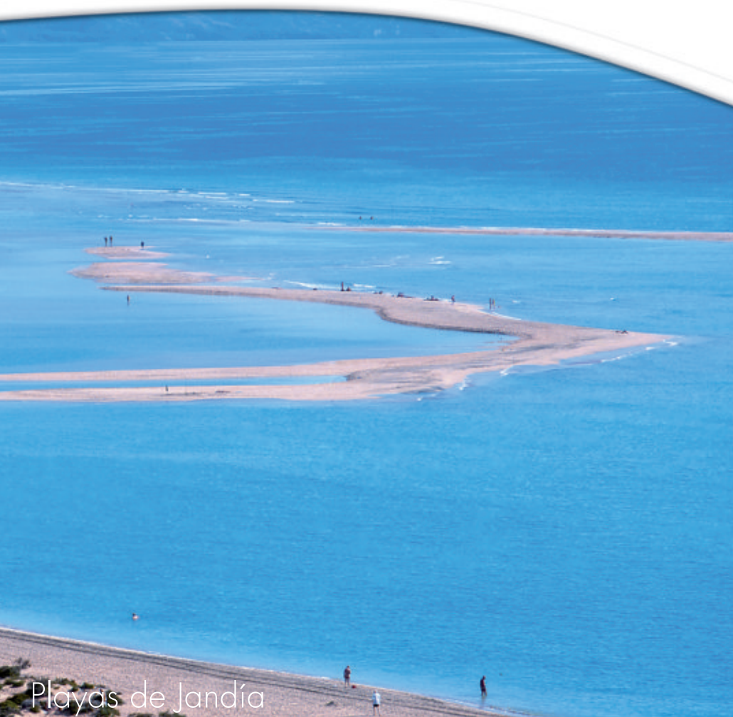
Playas de Jandía