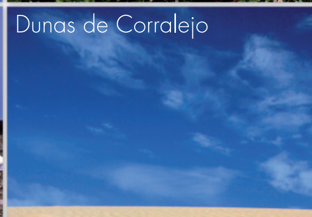
Dunas de Corralejo