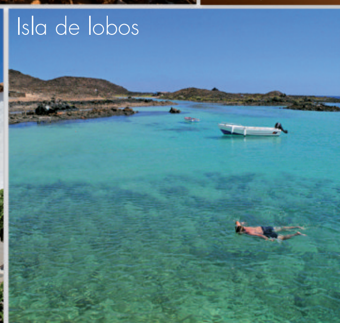
Isla de lobos