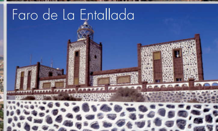
Faro de La Entallada