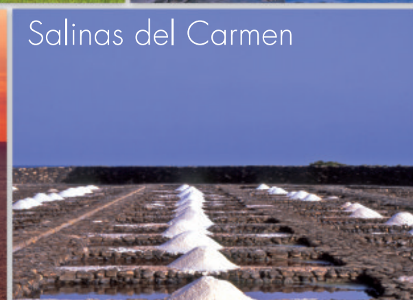
Salinas del Carmen