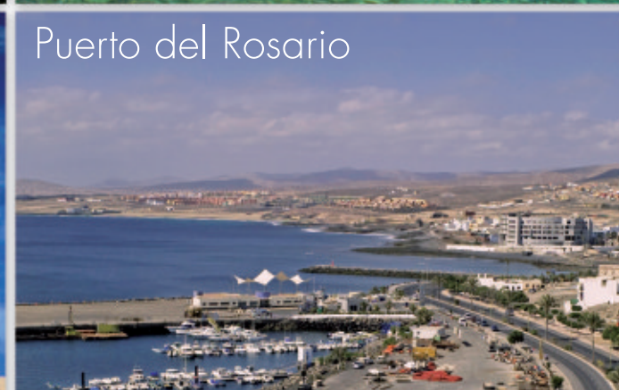
Puerto del Rosario