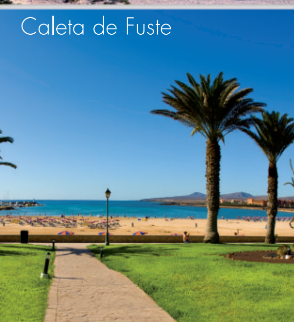
Caleta de Fuste